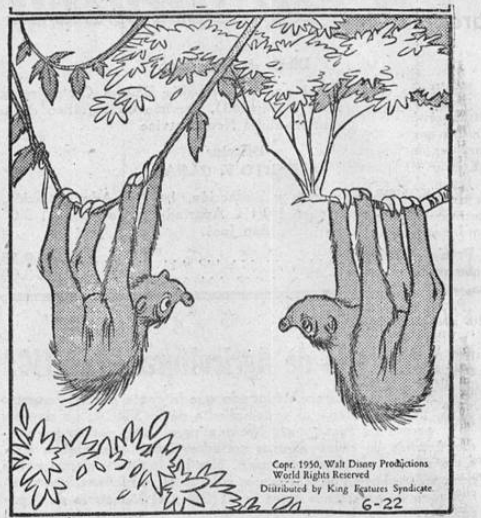
—¡Uf! Qué día! Me siento más viva que muerta!